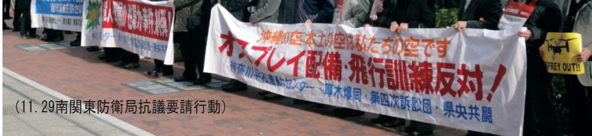
(11.29南関東防衛局抗議要請行動)

11月1日、米軍はオスプレイの飛行計画を防衛省に提出しました。その中には、厚木基地も使用されることが明記されていました。米軍は12月には本格運用をするとし、全国各地での低空飛行訓練を行なおうとしています。つまり、その時期には厚木基地にも、オスプレイが飛来するかもしれません。