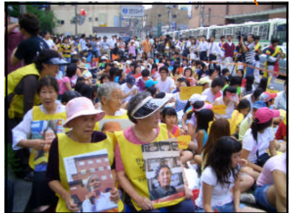
2006年8月の第721回水曜デモ

日本軍「慰安婦」問題は、「過去の問題」では決してありません。世界中で、アフリカや中東地域の人々までもが、「慰安婦」被害者に正義を、と連帯行動に立ち上がっているのはなぜなのでしょう。日本では、ほとんど知らされてはいませんが・・・