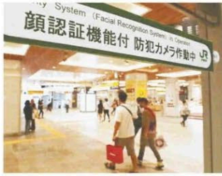
JR東の駅構内で、顔認識カメラが作動していることを知らせるステッカー

JR東日本が7月から、顔認識カメラを使って、刑務所からの出所者と仮出所者の一部を駅構内などで検知する防犯対策を実施していることが、わかった。必要に応じて手荷物検査を行うとしている。刑期を終えた人らの行動が監視、制限される可能性があり、議論を呼びそうだ。