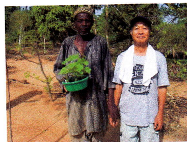
サコ氏と坂場さん