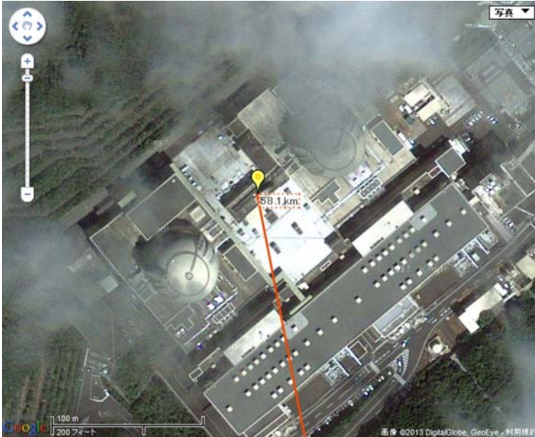
図1 大飯発電所3号機と4号機の原子炉建屋の中間地点（北緯35.55°、東経135.67°）を起点とした（画面中程の黄色い印）。黄色い印の右の円柱状の建物が大飯発電所3号機の、左の円柱状の建物が4号機の、それぞれ原子炉建屋である。

同ページで、大飯発電所3号機と4号機の原子炉建屋の中間地点（北緯35.55°、東経135.67°）を起点として、原告らの住所地を終点として入力すると、2点間の距離が表示される。（図1、図2参照）。