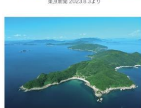
中央の入江が上関原発建設予定地。工事が中断し、その奥の中国電力の所有地に山林を伐採し中間貯蔵施設を建設する計画

署名: 私たちは、上関町「中間貯蔵施設」建設中止を強く求めます。 呼びかけ団体(山口県の5団体) 原発に反対する上関町民の会 上関原発を建てさせない祝島島民の会 上関の自然を守る会 原発いらん!山口ネットワーク 原水爆禁止山口県民会議