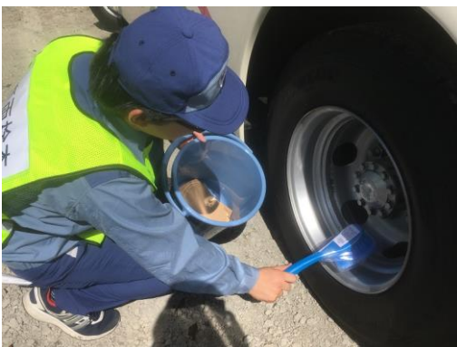
美山長谷運動広場での除染訓練 2018. 8. 26

美山長谷運動広場では拭き取り除染だが、昨年の訓練では、空のバケツとブラシで、閉電が除染の練習をしていた。↓