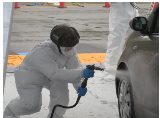
あやべ球場での流水除染 2016. 8. 27防災訓練