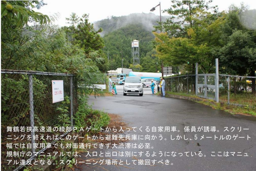
2016年8月防災訓練時に撮影 綾部PA 避難計画を案ずる関西連絡会