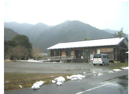
唯一の屋内施設 小さな管理棟