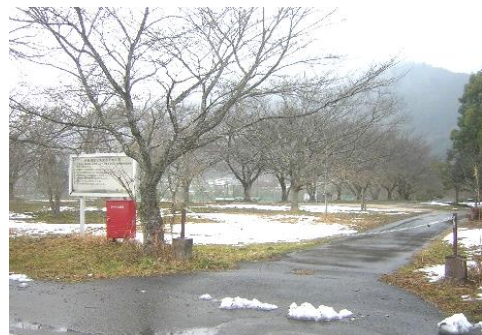
広場の入り口は狭い