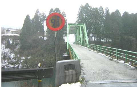
重量制限9トンの萱野橋