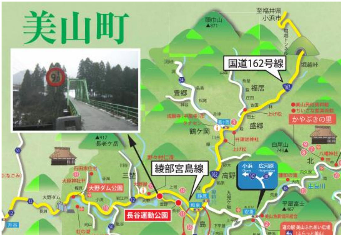
原発なしで暮らしたい丹波の会等のチラシより