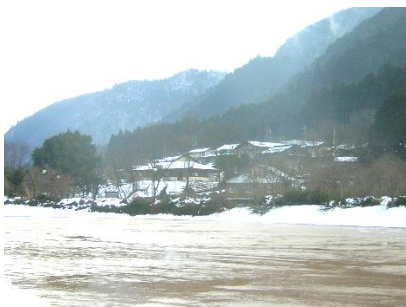
グラウンドのすぐそばに民家

6. 高浜原発から27.1km。UPZ内で検査。場所も狭すぎるため、30km圏内に長時間とどまることになり、検査待ちでさらに被ばくの可能性