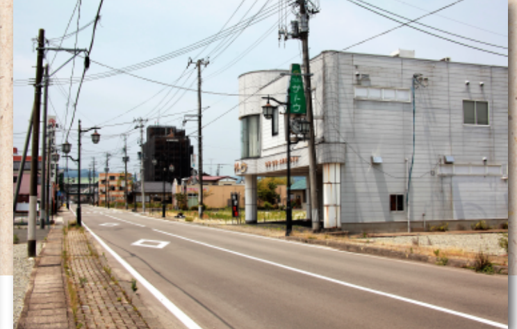
浪江町 2018.6.26 避難指示解除になったが人の姿はなかった