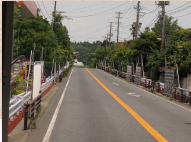
双葉町 2017.7.3 国道6号線バイク自転車は通行禁止両脇は帰還困難区域