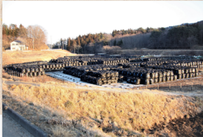
葛尾村 2019.2.24 8年が過ぎても除染土が田んぼに置かれている