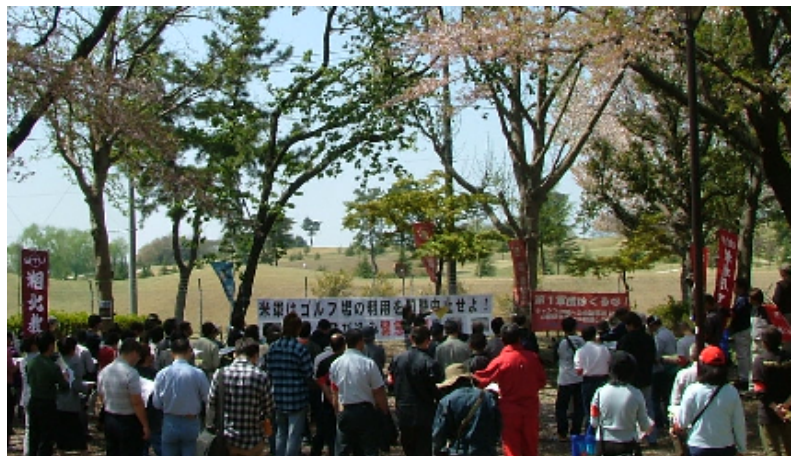
09年4月11日に開催された、ボール飛び込み緊急抗議集会（歓迎しない会主催）。今月18日、この公園にまたボールが飛び込んで来ました。

即刻業務停止命令が出されるべき状態です。しかし、相模原市の対応は今回も、原因の究明と必要な対策をとるよう申し入れるにとどまっています。相手が米軍だからでしょうか？相模原市に対して断固たる対応を取るよう訴えます。