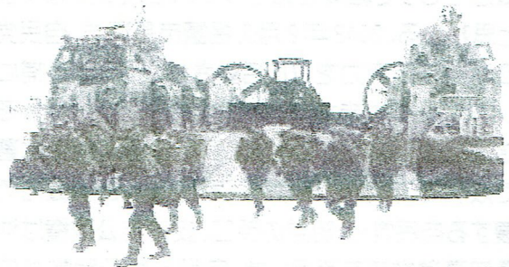
LCACから上陸する自衛隊員（種子島）

一方、米国防総省のホワイト報道官は10月19日、米韓の合同演習・ビジラント・エースを中止すると発表しました。