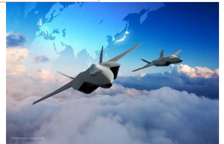
次期戦闘機のイメージ(防衛省)