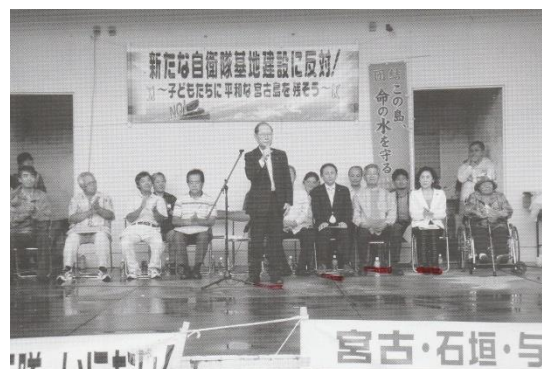
16年11月の自衛隊配備に反対する宮古島集会。沖縄選出の全国議員が参加した