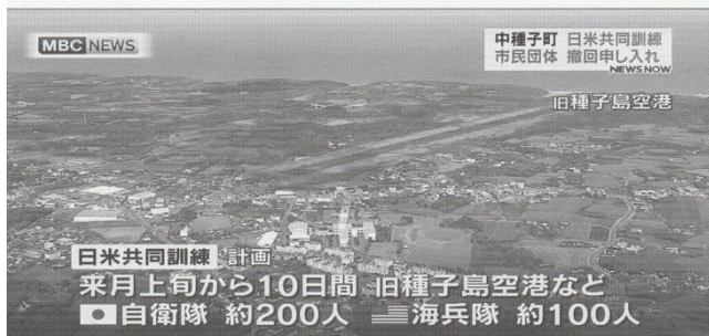
日米共同訓練を報じるMBC南日本放送。写真は旧種子島空港で、新空港開港後は使用されていない（滑走路が短い）。自衛隊は、このような南西諸島の旧空港などを、F35Bの基地として虎視眈々と狙っている