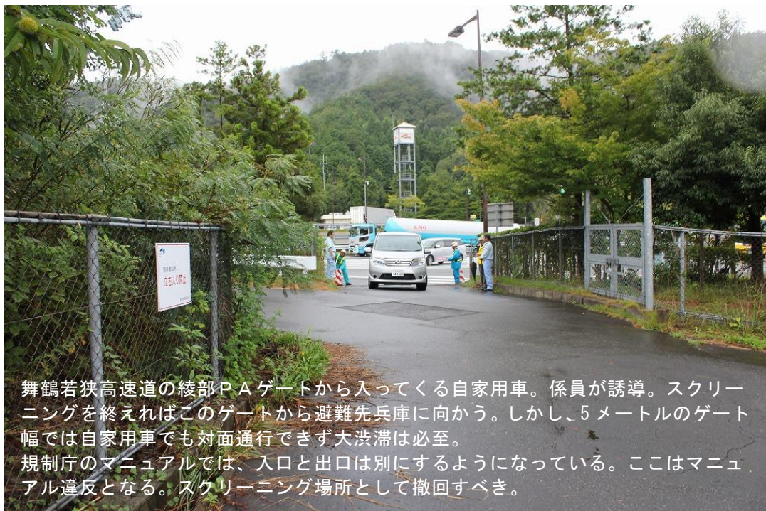
2016年8月防災訓練時に撮影 綾部PA 避難計画を案ずる関西連絡会

「原子力災害時における避難退域時検査及び簡易除染マニュアル」原子力規制庁 2017年1月30日修正 参考資料より http://www.nsr.go.jp/data/000119567.pdf