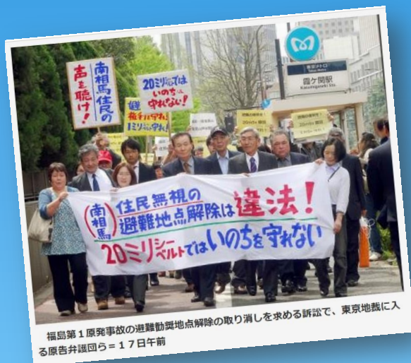
福島第1原発事故の避難動員地点解除の取り消しを求める訴訟で、東京地裁に入 る原告弁護団ら＝17日前

年20ミリシーベルトという避難基準、 社会的合意なき帰還促進政策——。 住宅支援の打ち切りなど、避難者に対する 「兵糧攻め」。 福島原発事故を「なかったこと」にし、 被ばく影響を無視する原子カムのたくら みに、みんなで立ち向かおう！