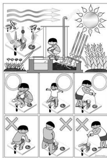
図2(2) エコサン・トイレの使用方法