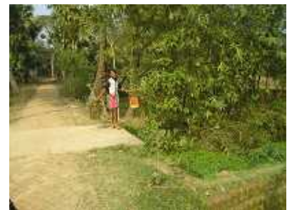
写真4 掃除人による排泄物の水路への投棄、この村では80%の世帯が掃除人に委託