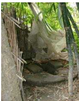
写真1 放棄されたピットラトリン

バングラデシュでは、ほとんどの地域で、排泄物の衛生的処分システムは存在していない。また、排泄物の引抜きは人力によって行われているため、その作業は多くの人から嫌悪されている。よく目にするピットラトリンの状況や、トイレ掃除人の排泄物処分の実態を写真に示す。