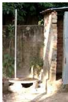
写真2 故意に穴があけられたピットラトリン