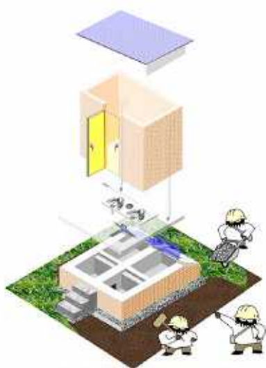
図2(1) エコサン・トイレのデザイン

バングラデシュの農村において、先に述べた要件を満足するトイレデザインの例を示す。トイレ設計にあたっては、まず、病原体を含む便と病原体を含まず栄養分に富む尿を分離する。尿については、水で希釈し農地等へ散布する。便の利用方法については、便の乾燥と安全化をすすめ農地へ還元する。また、この国では、排便後肛門を水で洗う習慣があり、排便後の洗浄水を便の貯留槽に入れず、隣接する蒸発用苗床に導く。便の貯留槽は2槽設けて交互に使用し、農地に散布する前に数ヶ月（最低6ヶ月を目安としている）の貯留期間を確保する。さらに、防水性に留意した貯留槽は地上に設け、便器のステップ高さを地面から70cmほど高くすることで、洪水時に冠水する頻度を低減させる。図2にこのトイレの構造と使用方法を示す。