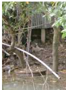
写真3 雨季に水没するピットラトリン