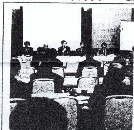
各分野の研究成果が

喜久町六番五号(NJS高久ビル別館三階) TEL/FAX 03-3111-5363 03-3111-5361