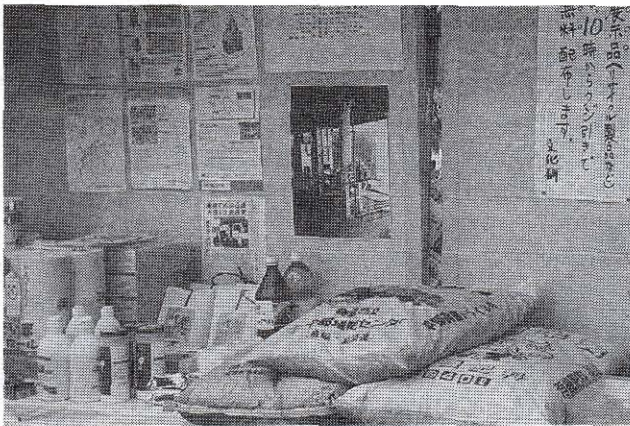
▲リサイクルコーナー（有機肥料の大袋にご注目）