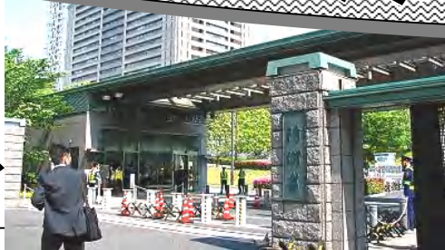
防衛省 正門側 路上