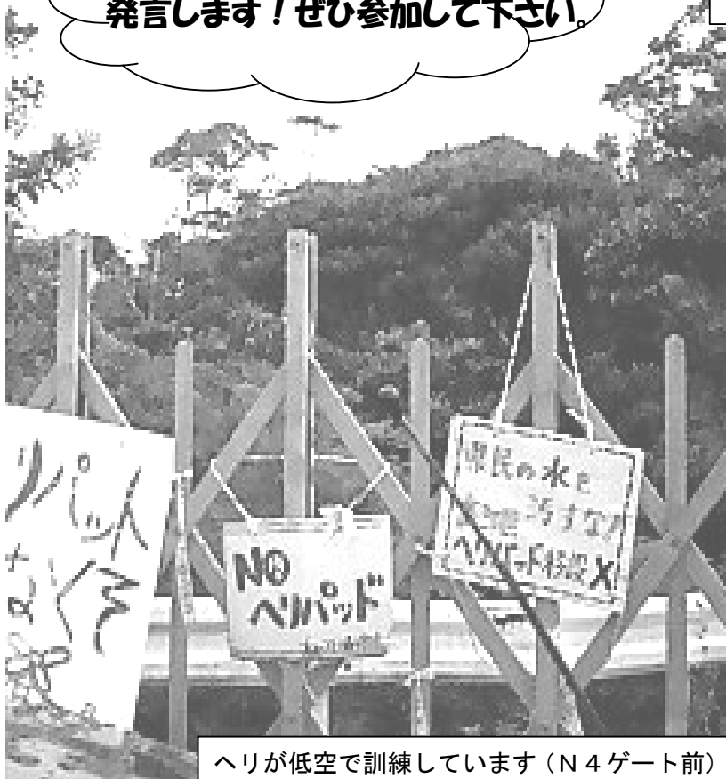
ヘリが低空で訓練しています(N4ゲート前)