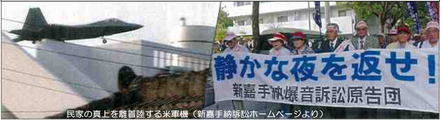
民家の真上を離着陸する米軍機（新嘉手納訴訟ホームページより）