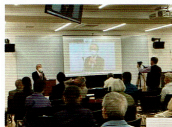
近藤昭一衆議院議員のあいさつ