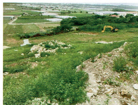
魂魄の塔の近くの熊野鉱山

法律上遺骨は国が収集することになっています。しかし、政府は収集活動をしていません。