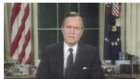
湾岸戦争の開始を宣言するブッシュ大統領