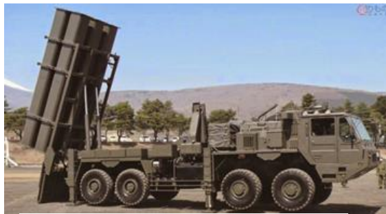
南西諸島に配備される12式地对艦誘導弾・SSM