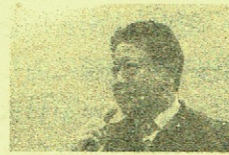
名古屋大学法学部 憲法学・平和学